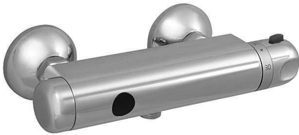
SLS 03S (cu ieșire în jos)